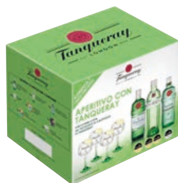
KIT SERVE THE BEST TANQUERAY 2,5L