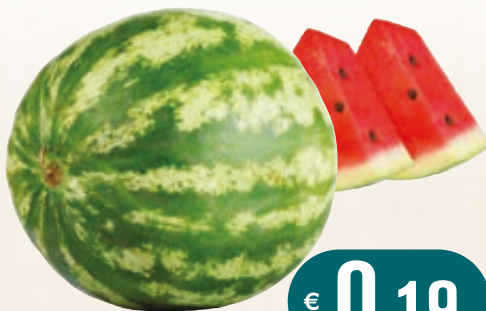
ANGURIE AL KG