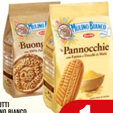
BISCOTTI MULINO BIANCO PANNOCCHE/ RIGOLI/ BUON GRANO/ CAMPAGNOLE 350/400G