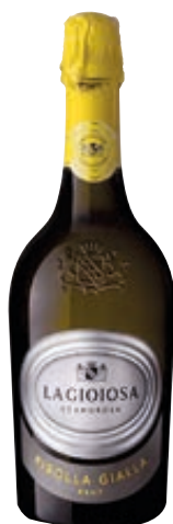
SPUMANTE RIBOLLA BRUNT LA GIOIOSA 75CL