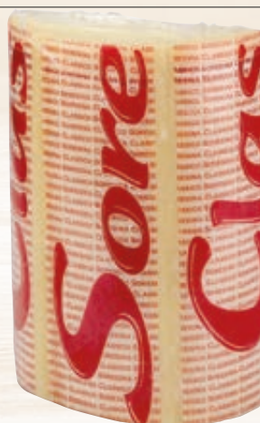
PROVOLONE TRANCIO PICCANTE SORESINA 3,5KG AL KG