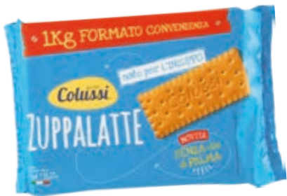
BISCOTTO ZUPPALATTE COLUSSI 1KG