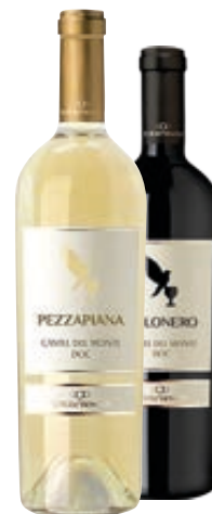
VINO CASTEL DEL MONTE DOC TORREVENTO BOLONERO/ PEZZAPIANA/ PRIMARONDA 75CL