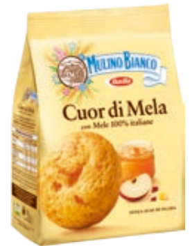
BISCOTTI CUOR DI MELA MULINO BIANCO 300G