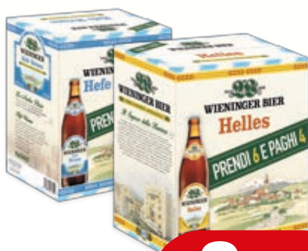
BIRRA WIENINGER HELLES/ WEISS 50CL X 4+2