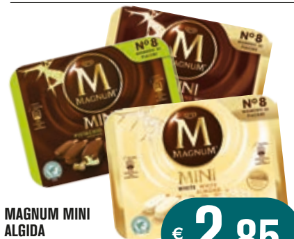
MAGNUM MINI ALGIDA X8 352G VARI GUSTI