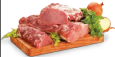
LONZA DI SUINO INTERA SOTTOVUOTO AL KG