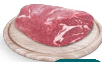
CUORE DI REALE DI BOVINO ADULTO ARGENTINO AL KG