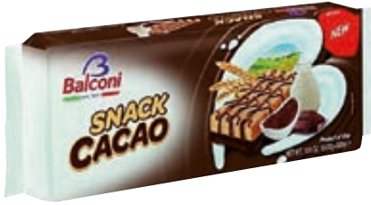
SNACK AL CACAO BALCONI 330G