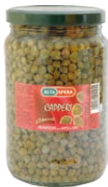
CAPPERI ALTASFERA 1,7KG