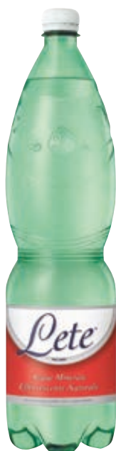
ACQUA LETE 1,5L