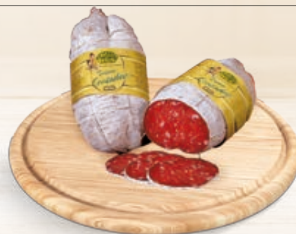
SALAME CONTADINO CAVAZZUTI AL KG