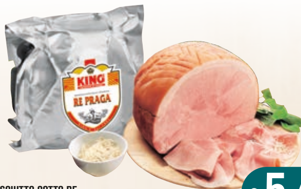
PROSCIUTTO COTTO RE PRAGAKING'S 1/2 SV - AL KG