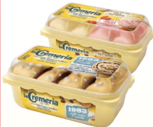
GELATO LA CREMERIA GUSTI ASSORTITI 500G