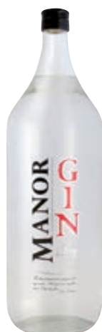
GIN MANOR BELTION 2L