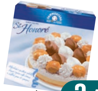
TORTA ST.HONORÈ SAMMONTANA 750G