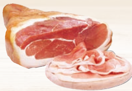
PROSCIUTTO CRUDO NAZIONALE SENZA OSSO PRESSATO/ ADDOBBO AL KG