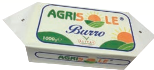
BURRO AGRISOLE ALIVAL 1000G