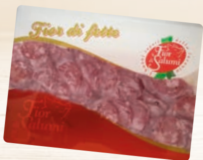
SALSICCIA PICCANTE/ DOLCE AFFETTATA FIOR DI SALUMI 500G AL PEZZO