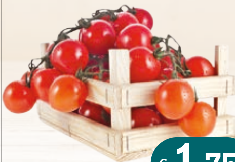
POMODORO CILIEGINO AL KG