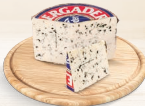
BERGADER ROTONDO PICCANTE 2,3KG AL KG