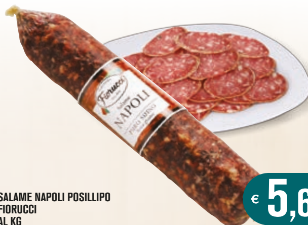
SALAME NAPOLI POSILLIPO FIORUCCI AL KG