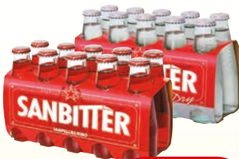
SANBITTER SAN PELLEGRINO CLASSICO/ DRY 10CL X10