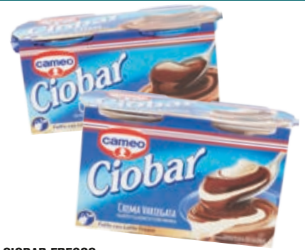
CIOBAR FRESCO CAMEO CLASSICO/ VARIEGATO ALLA PANNA 100G X2/ DOPPIO CIOCCOLATO 50G X4