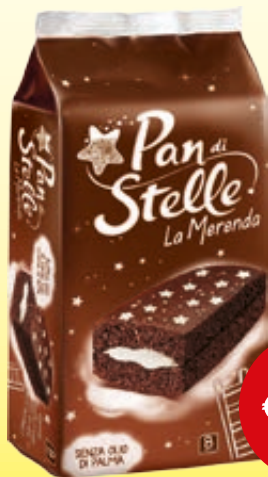
MERENDINA PAN DI STELLE MULINO BIANCO 280G