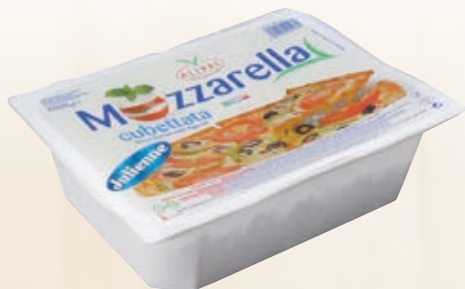
MOZZARELLA JULIENNE ALIVAL AL KG