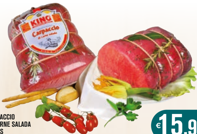
CARPACCIO DI CARNE SALADA KING'S AL KG