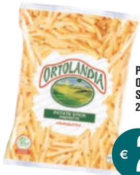
PATATE SURGELATE ORTOLANDIA STICKHOUSE 2,5KG