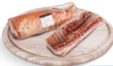
CARRÈ DI AGNELLO NUOVA ZELANDA CONGELATO K2 AL KG