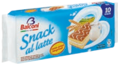
SNACK AL LATTE BALCONI 280G