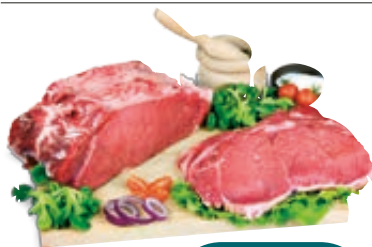
ENTRECOTE DI BOVINO ADULTO AL KG