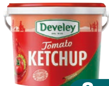
KETCHUP DEVELEY 5KG