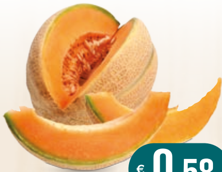
MELONE RETATO AL KG