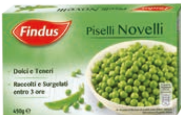
PISELLI NOVELLI FINDUS 450G