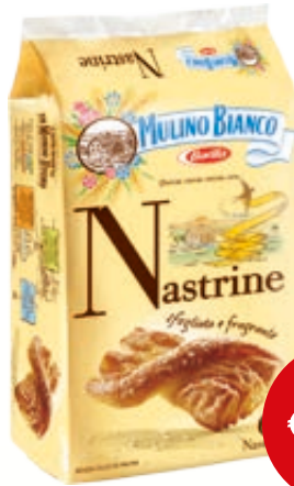
NASTRINE MULINO BIANCO 240G