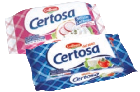
CERTOSA CLASSICA/ SENZA LATTOSIO GALBANI 165G