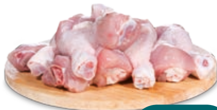
FUSI DI POLLO SFUSI AL KG