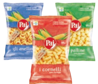
CORNETTI/ ANELLINI/ PALLINE PAI - 125G