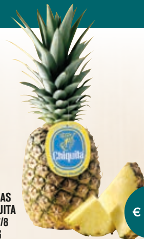
ANANAS CHIQUITA CAL 7/8 AL KG