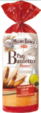
PANE BIANCO MULINO BIANCO 400G