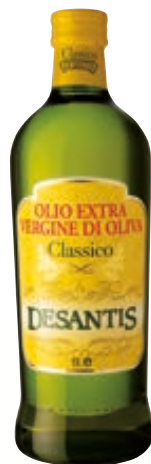
OLIO EXTRA VERGINE D'OLIVA DESANTIS CLASSICO 1L