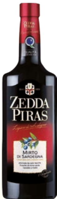
LIQUORE ZEDDA PIRAS MIRTO 50CL