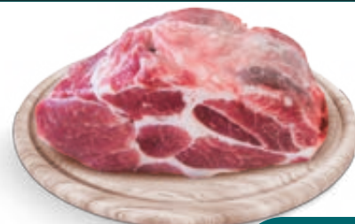
COPPA DI SUINO SENZ'OSSO AL KG