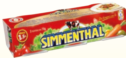
CARNE IN GELATINA SIMMENTHAL 70G X3