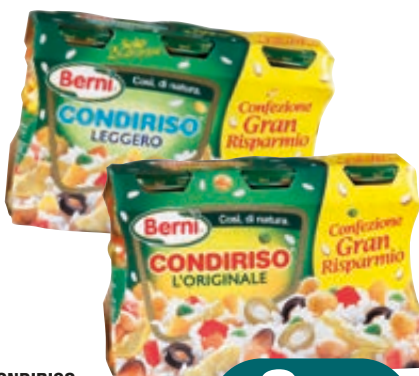
CONDIRISO BERNI ORIGINALE/ LEGGERO 314G X3