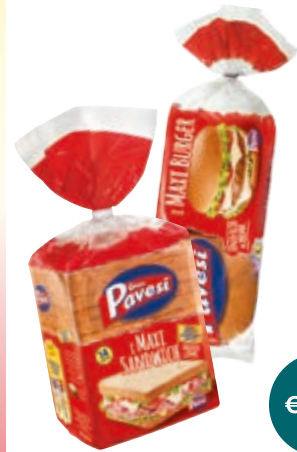
MAXI BURGER 300G/ MAXI SANDWICH 550G PAVESI 1L