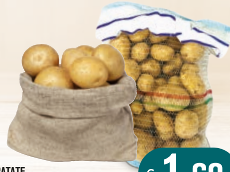
PATATE RETE DA 4KG AL KG