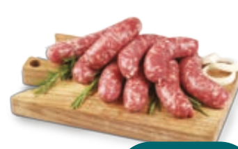
SALSICCOTTO DI SUINO SFUSO VARI TIPI AL KG