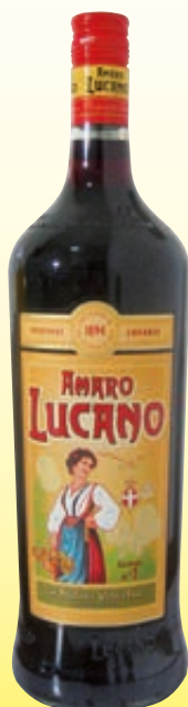
AMARO LUCANO 1,5L