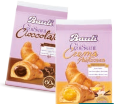
GROSSANT FARCITI BAULI GUSTI ASSORTITI X6 300G