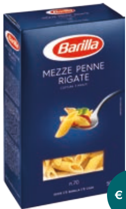
PASTA DI SEMOLA BARILLA VARI TIPI 500G