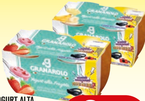
YOGURT ALTA QUALITÀ GRANAROLO GUSTI ASSORTITI 125G X2