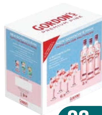
KIT SERVE THE BEST GORDON PINK