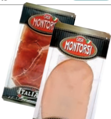
AFFETTATI MONTORSI VARI TIPI 60G