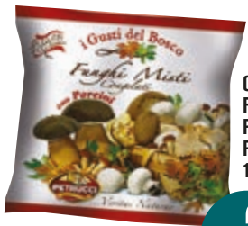
CARCIOFI A SPICCHI/ FUNGHI MISTI CON PORCINI PETRUCCI 1KG