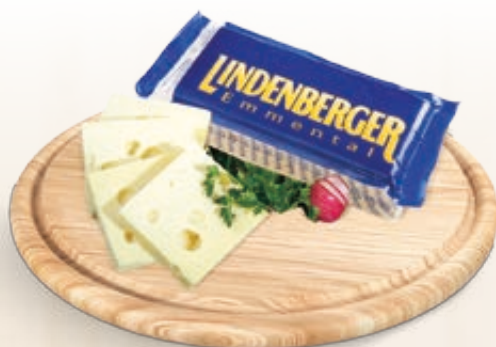
EMMENTAL LINDENBERGER AL KG