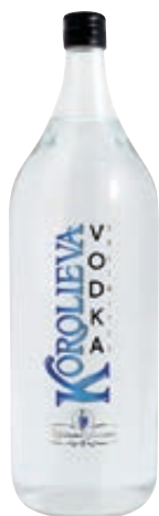
VODKA KOROLIEVA UNLIMITED 2L