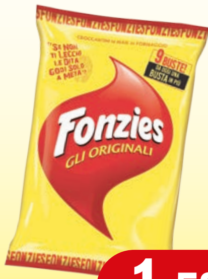
FONZIES MULTIPACK 23,5G X 9