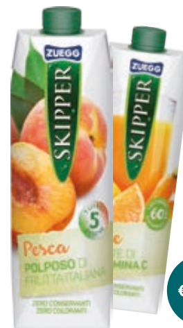
NETTARE/ SUCCO SKIPPER GUSTI ASSORTITI 1L