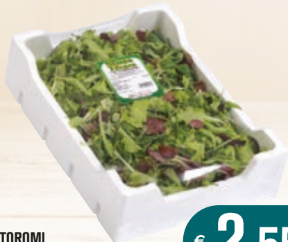
ORTOROMI TUTTE INSIEME 500 G