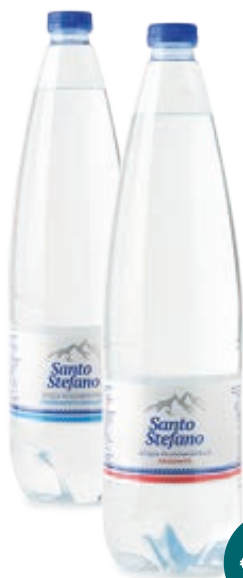
ACQUA SANTO STEFANO 1L NATURALE/ FRIZZANTE