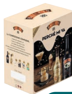
KIT SERVE THE BEST BAILEY'S 2,5L