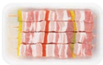
SPIEDINI DI SUINO CON PEPERONI AL KG