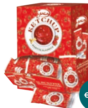
BUSTINE KETCHUP GAIA 12G IN BOX