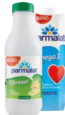
LATTE UHT PARMALAT CALCIUM PLUS/ FIBRESSE/ OMEGA 3 1L