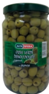
ALTASFERA OLIVE DENOCCIOLATE VERDI 1,67KG