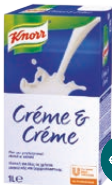
CREME & CREME KNORR PROFESSIONAL 1L