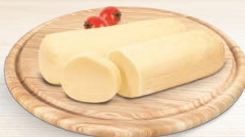
FORMAGGIO FILATA 5KG CA. AL KG