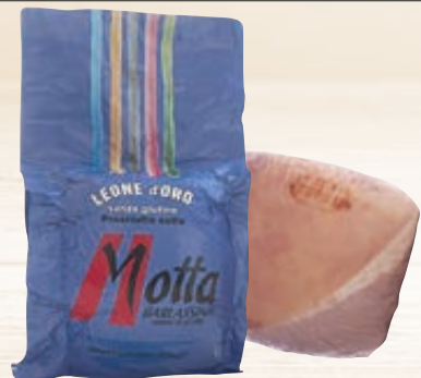
PROSCIUTTO COTTO LEONE MOTTA AL KG