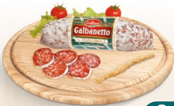
SALAME GALBANETTO GALBANI AL KG