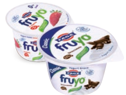
CERTOSA CLASSICA/ SENZA LATTOSIO GALBANI 165G