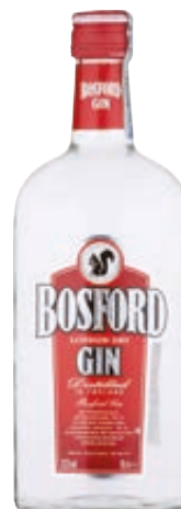
GIN BOSFORD 70CL