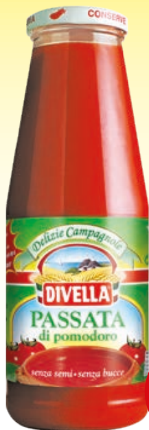
PASSATA DI POMODORO DIVELLA 680G