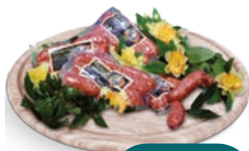
SALSICCIA DI NORCIA LANZI AL KG