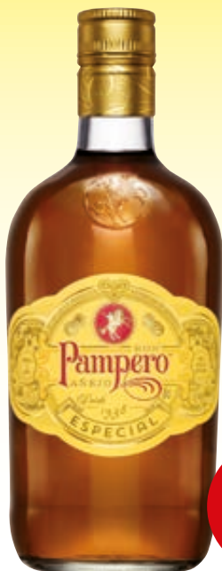
RUM PAMPERO ESPECIAL 70CL