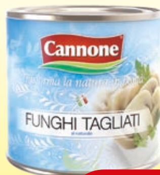
FUNGHI TAGLIATI AL NATURALE CANNONE 3KG