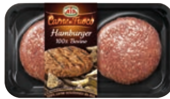
HAMBURGER DI BOVINO ADULTO SKIN 2 X 100G