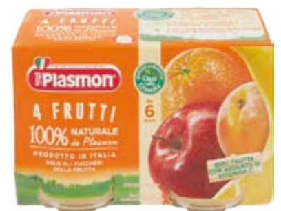
OMOGENEIZZATI ALLA FRUTTA PLASMON GUSTI ASSORTITI 104G X2