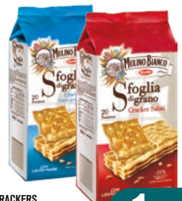
CRACKERS MULINO BIANCO SALATI/ NON SALATI 500G