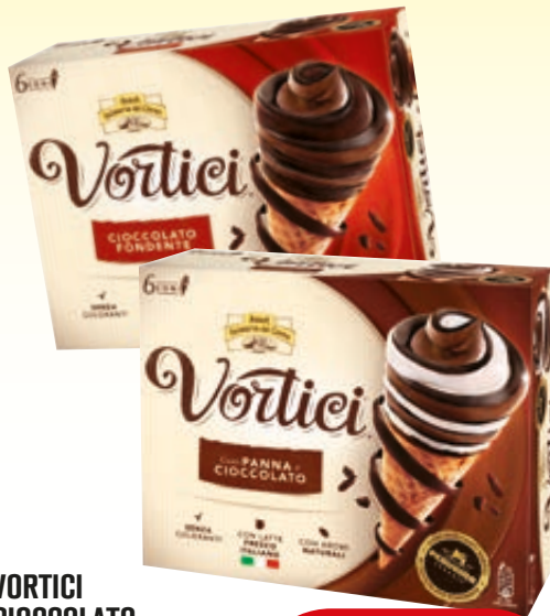
VORTICI CIOCCOLATO FONDENTE/ PANNA E CIOCCOLATO X6