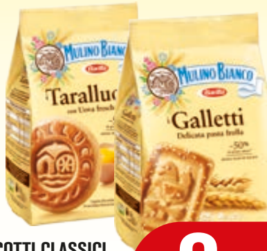
BISCOTTI CLASSICI MULINO BIANCO VARI TIPI 350/400G