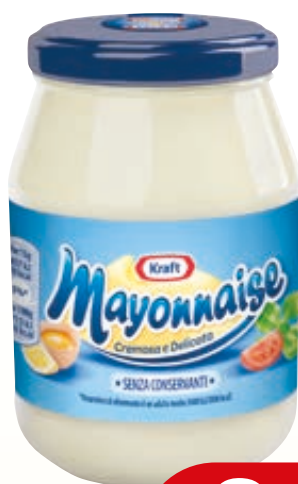
MAYONNAISE KRAFT 200ML