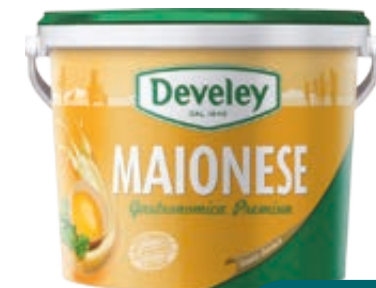
MAIONESE GASTRONOMICA PREMIUM DEVELEY 5KG