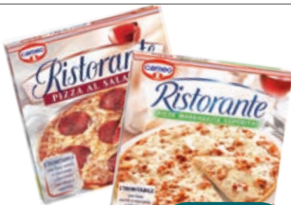
PIZZA RISTORANTE CAMEO VARI TIPI DA 320G A 365G