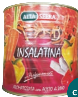
INSALATINA ALTASFERA 2,6KG