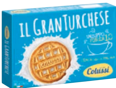
GRAN TURCHESE COLUSSI 400G