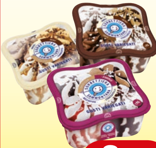
SORBETTIERA SAMMONTANA GUSTI ASSORTITI 1KG