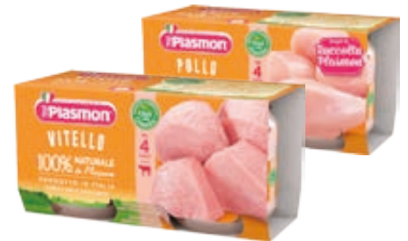
OMOGENEIZZATI ALLA CARNE PLASMON VARI TIPI 80G X 2