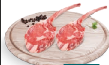
TOMAHAWK SCOTTONA SV - PORZIONATO AL KG