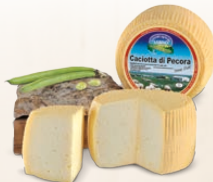
CACIOTTA DI PECORA PRIMO SALE AZIENDA AGRICOLA SABINO AL KG