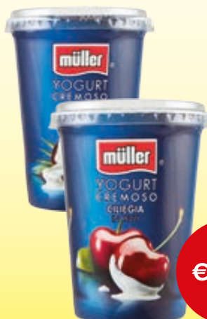
YOGURT CREMOSO CON FRUTTA MULLER VARI GUSTI 500G