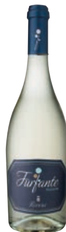
VINO FURFANTE BIANCO RIVERA 75CL