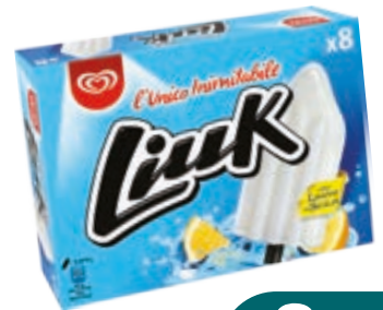
LIUK LIMONE ALGIDA X 8 632G