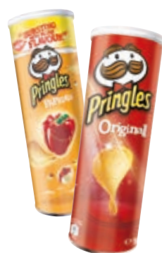
PRINGLES VARI GUSTI 165G