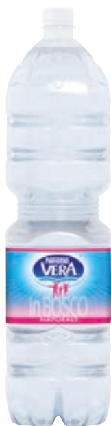
ACQUA MINERALE NATURALE VERA 2L