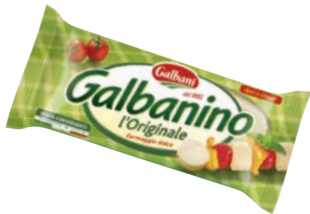
GALBANINO GALBANI 270G