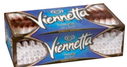
VIENNETTA ALLA VANIGLIA ALGIDA 360G