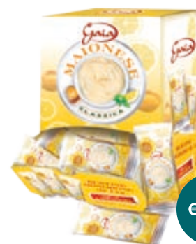
BUSTINE MAIONESE GAIA 12G IN BOX