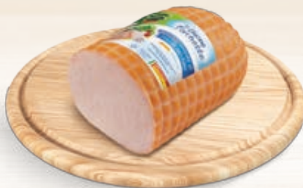
FESA DI TACCHINO GRAN ROSTY AMADORI AL KG