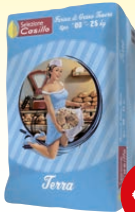
FARINA 00 CASILLO