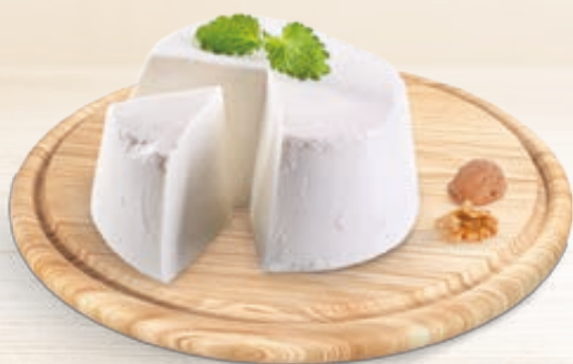
RICOTTA DURA TOSCANELLA AL KG