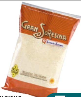
GRANA PADANO SORESINA GRATTUGIATO 1KG