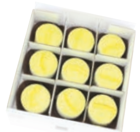
DELIZIA AL LIMONE MONOPORZIONE DOLCE TUSCIA 9 X 80G