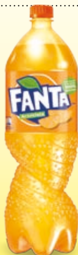
BIBITA FANTA 1,5L