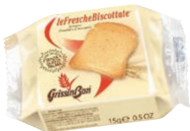
FETTE BISCOTTATE HOTEL GRISSIN BON 15G