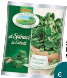
SPINACI LA VALLE DEGLI ORTI 900G