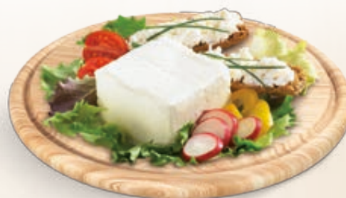
ROBIOLA OSELLA 200G X 4 AL KG