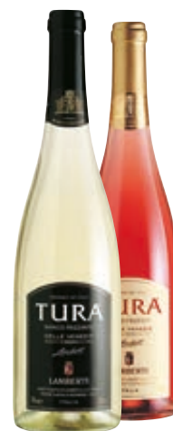
VINO IGT FRIZZANTE TURÀ BIANCO/ ROSATO 75CL