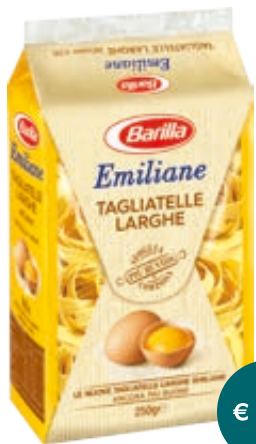
EMILIANE ALL'UOVO BARILLA VARI TIPI 250G