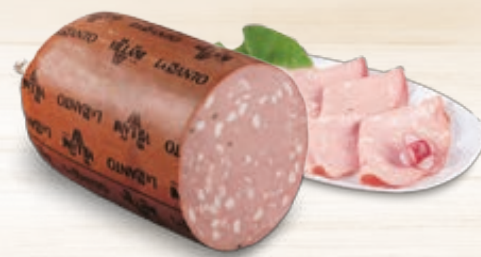
MORTADELLA BOLOGNA IGP LA SANTO VILLANI AL KG