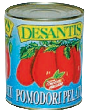
POMODORI PELATI DESANTIS 3KG