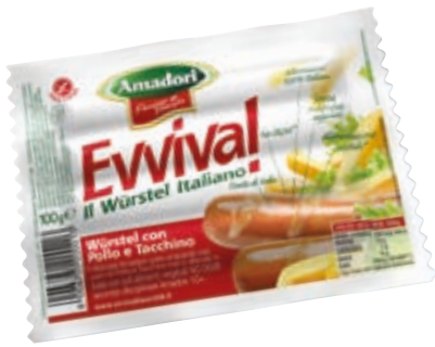
WURSTEL DI POLLO E TACCHINO AMADORI 100G